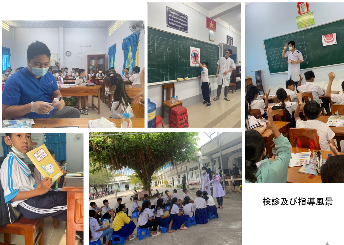
検診及び指導風景