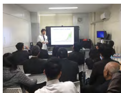
受入研修(2019.01 大分大学病院)

こちらが研修の様子です。似たような写真になりますが、このような形で実施しました。