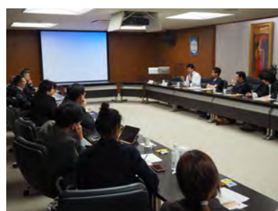
受入研修(2019.01 埼玉国際医療センター)