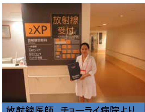
放射線医師 チョーライ病院より