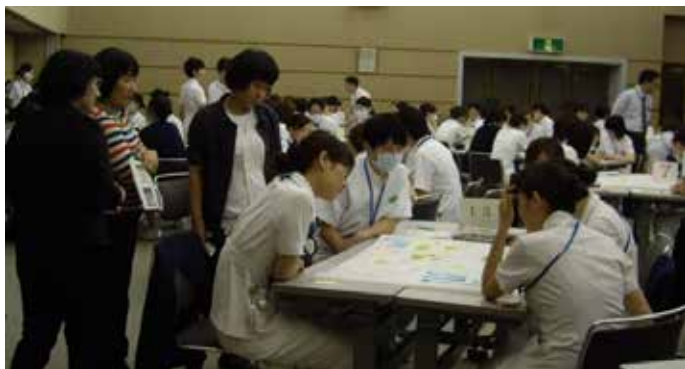
NCGM院内研修後輩育成参加