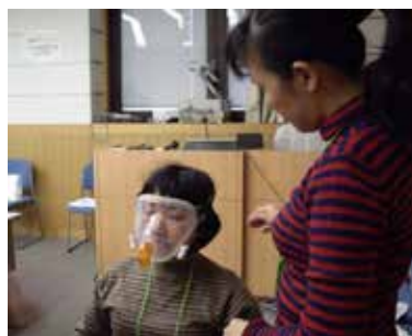
NCGM院内研修医療安全参加