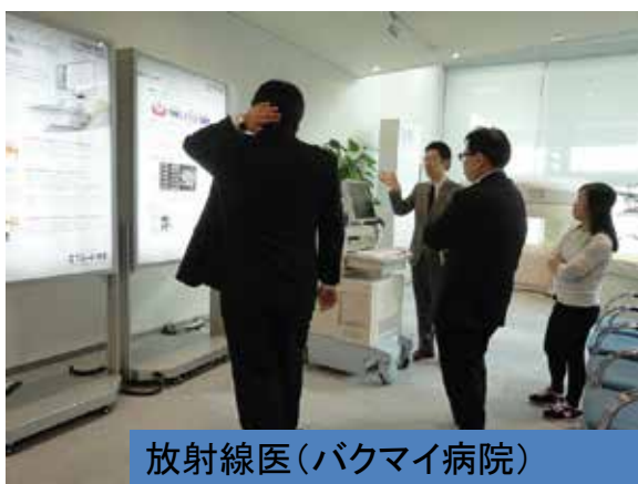
放射線医 (バクマイ病院)