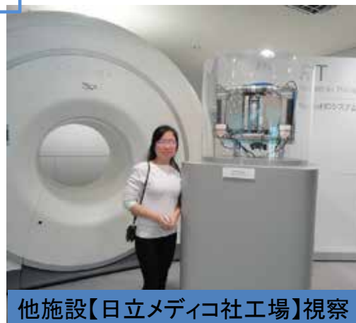
他施設【日立メディコ社工場】視察