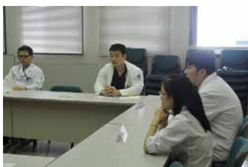
NCGM研修呼吸器内科・放射線科報告会