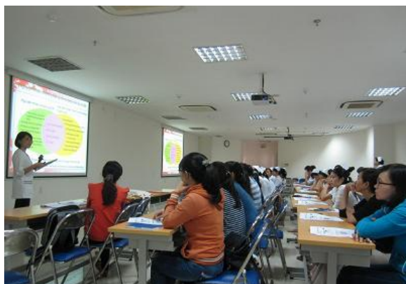
チョーライ病院褥瘡予防・創傷処置セミナー