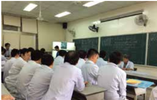
チョーライ病院脳外科カンファレンス