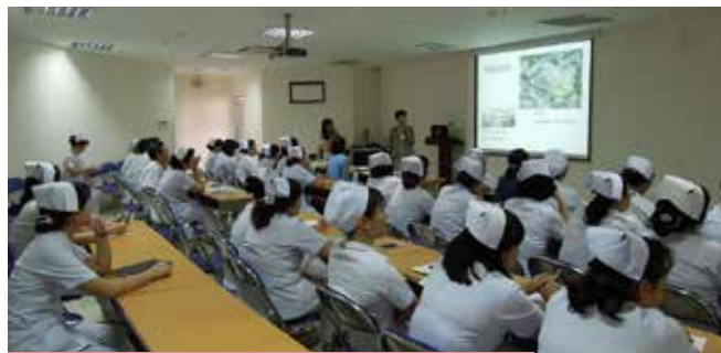
チョーライ病院看護管理セミナー