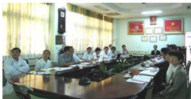
チョーライ病院幹部へのNCGM研修報告・活動後報告