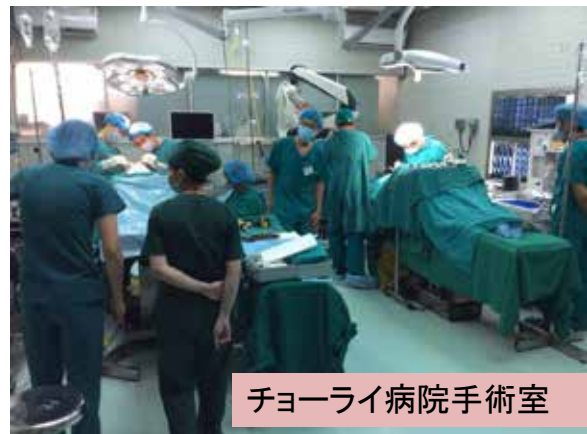
チョーライ病院手術室