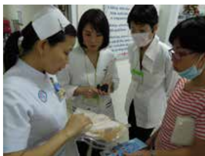
病棟における人工肛門物品確認