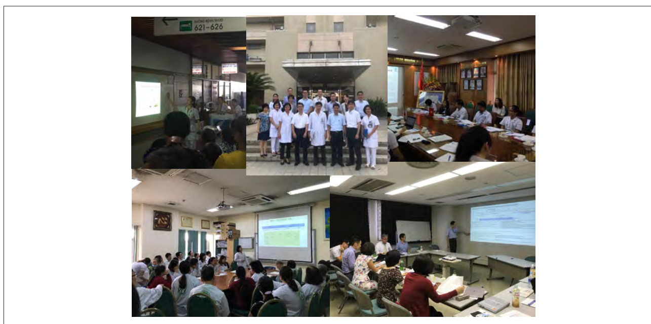
これは実際の研修の様子です。

この1年間の活動スケジュールを示します。ベトナムでの実地研修は8月と1月に2回、日本での研修は10月とし、計3回の研修を行いました。また、1月の研修では、バックマイ病院の他、2020年度の活動も念頭に、今回作成した服薬支援ツールの実用性等について、別の医療機関の意見も確認すべく、ベトナム北部の地方病院2施設を訪問しました。